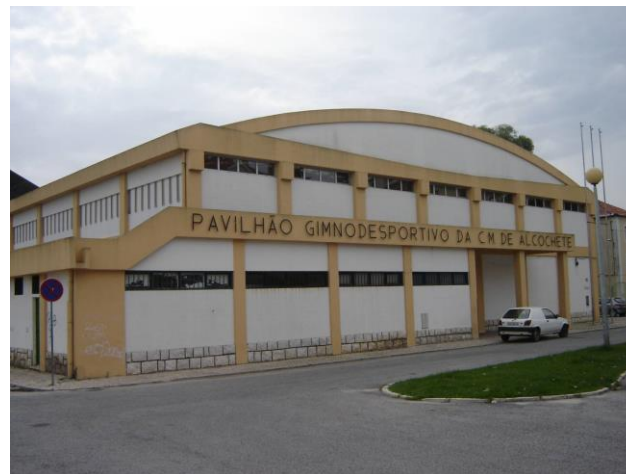
Pavilhão Municipal de Alcochete